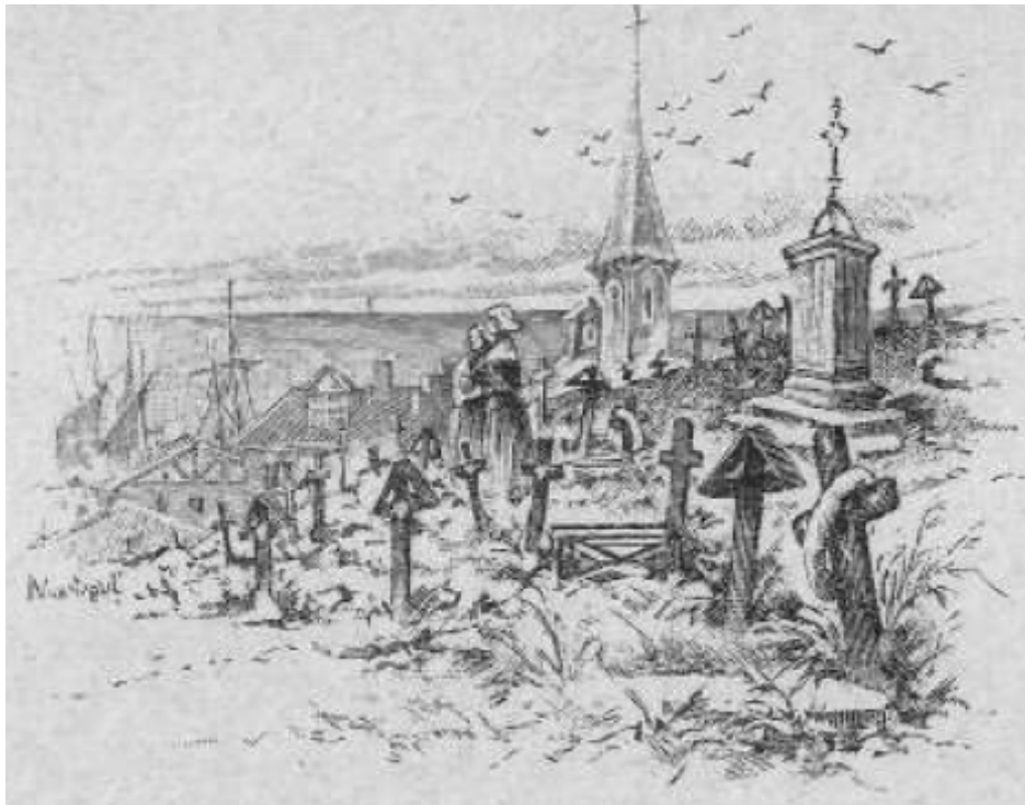
Erikshald par Christiania.

« Eh bien ! ma chère Éline, j'ai suivi votre conseil, j'ai tenté de m'arracher à cette vie de servage où la miette de pain gagné me semblait si dure ; et, puisque mon corps, trop débile pour les volontés de mon âme, me condamne à végéter hors de mon cher couvent avec la flamme du sanctuaire brûlant en moi, j'ai voulu l'abriter, cette flamme pure, au creux du fiord natal, devant cette mer de Norvège que je n'avais pas revue depuis quinze ans.