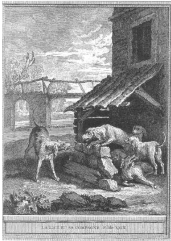
LA LICE ET SES COMPAGNES. Pl. de XXIX.