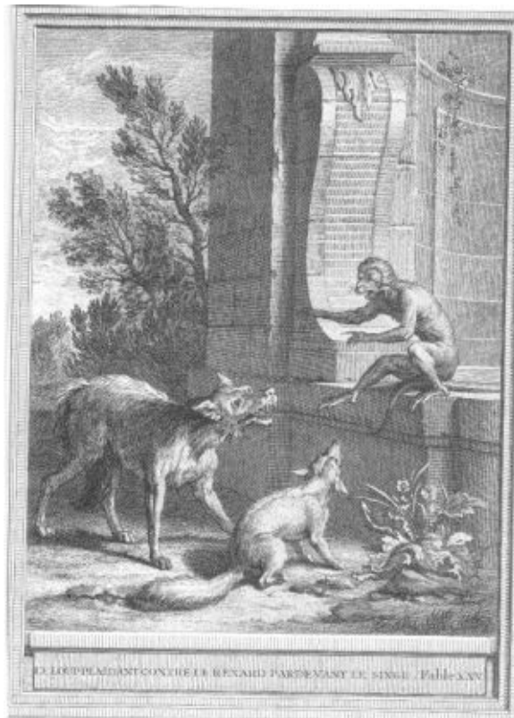
LE LÉOPARD DANTON CHEZ LE RENARD PARSEVANT. LE. SINGE. Fable XXX.