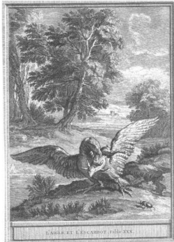
L'ÉAGLE ET LE CARBOT. Pl. XXX.