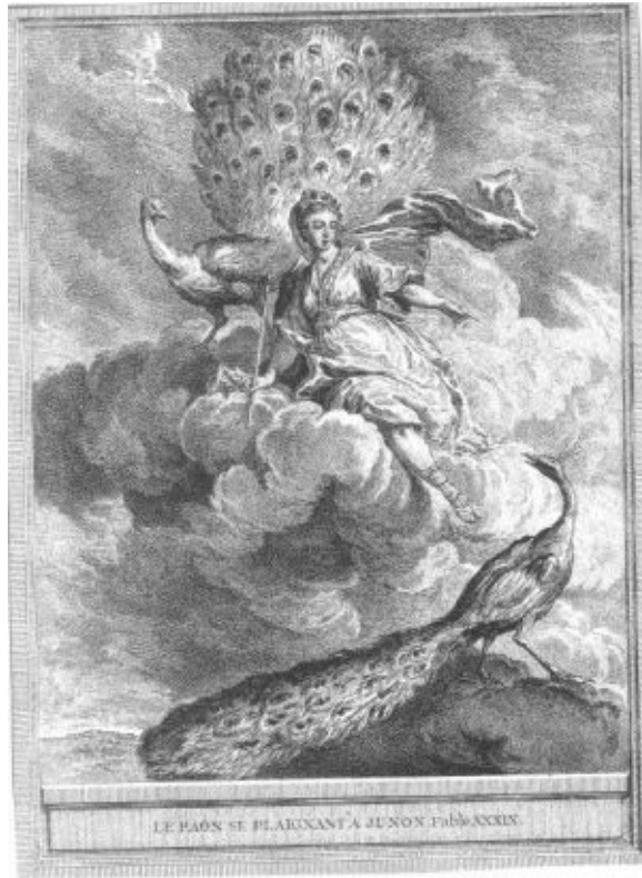
LE PAON SE PLAIGNANT A JUNON. P. 200. XXXIX.