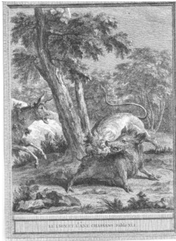
LE LION ET LE BUFFLE CHASSÉS PAR LE SÈLE.